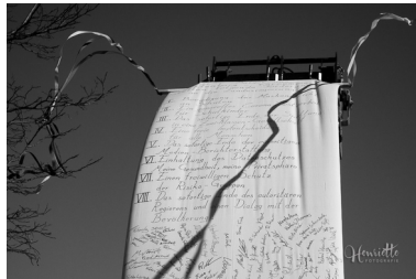
Der fliegende Otto